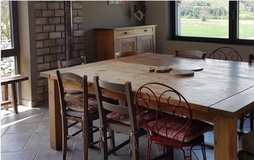
Salle à manger du gîte Le Grand R à Savourmon