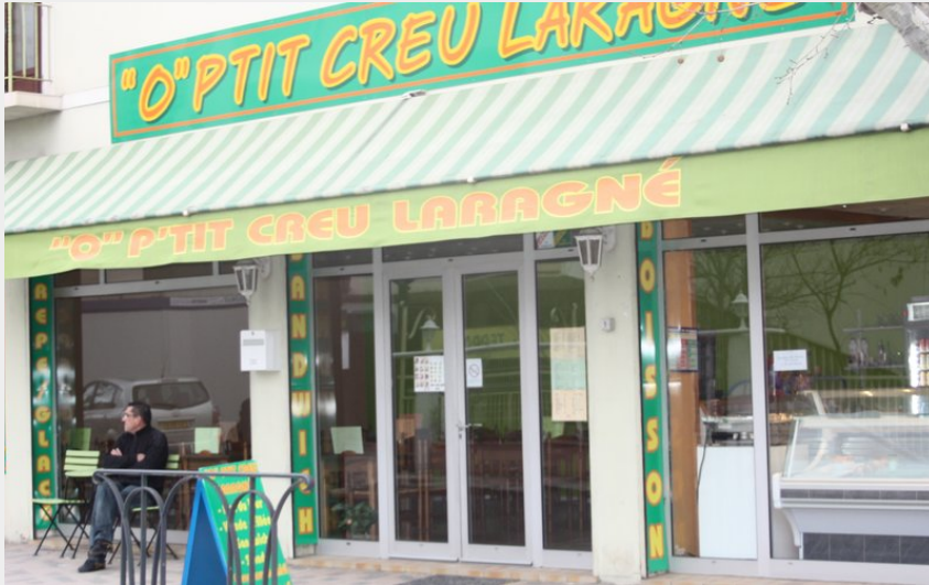
"O" Ptit Creu Laragné à Laragne