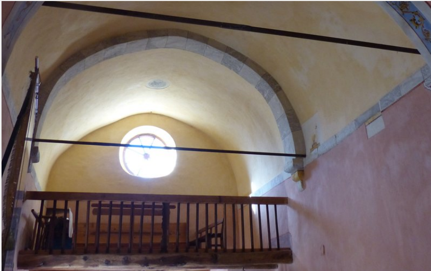
Crédit photo : Décors peints de l'Église Saint-Michel (Marie Lombard)