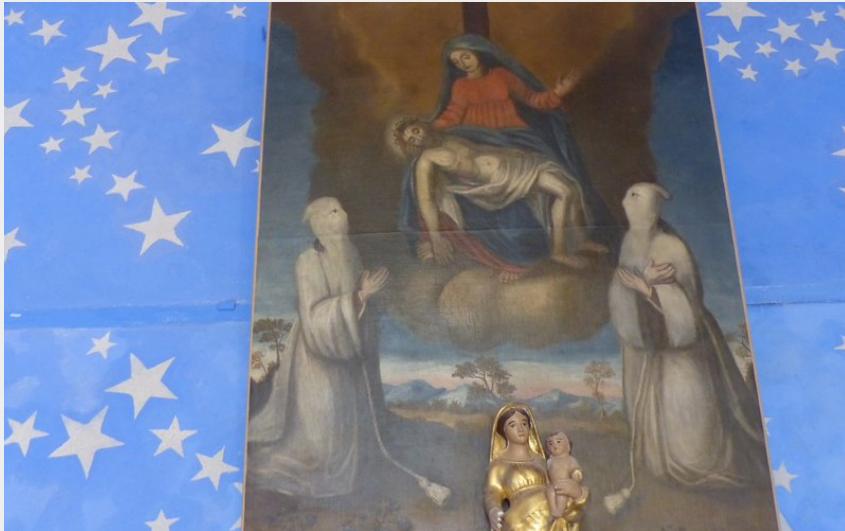
Crédit photo : Tableau dans la chapelle des Pénitents (Marie Lombard)