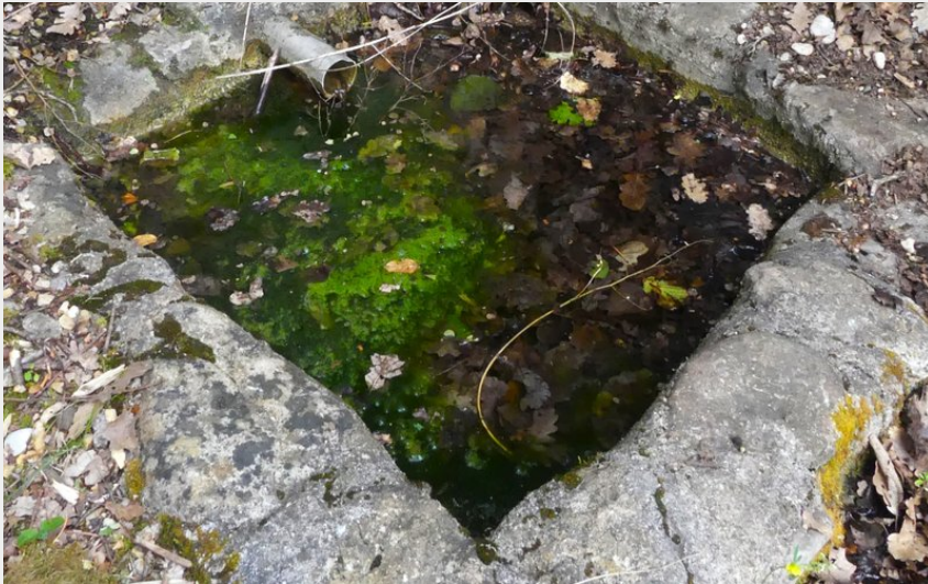
Fontaine des malades de Trescléoux