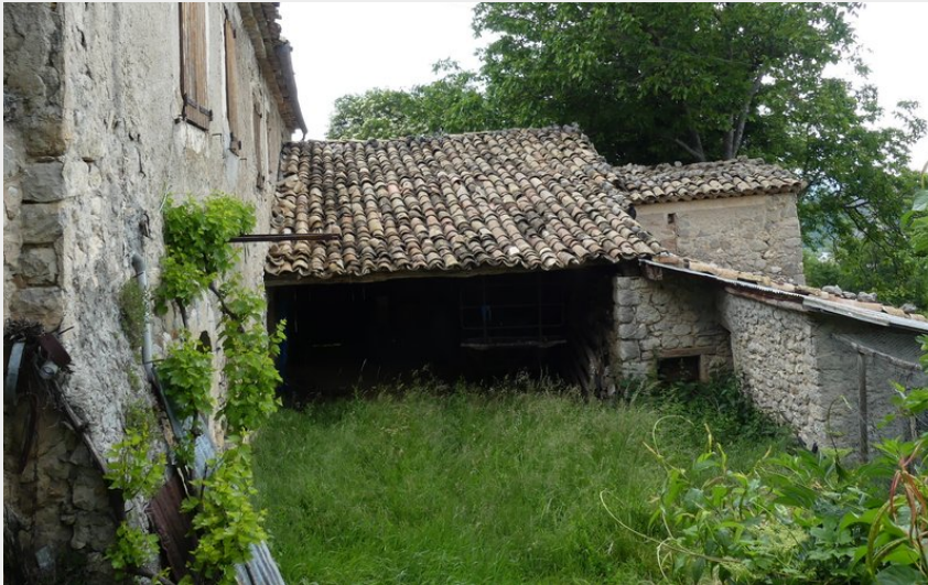
Crédit photo : La cour intérieure de la ferme des Granges (ALaurent/PnrBp)