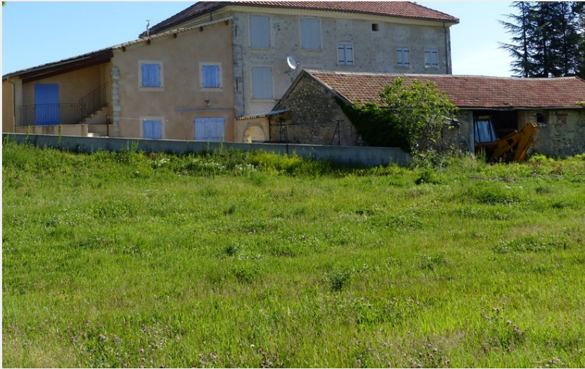
Crédit photo : La ferme du château du Plan, vue du sud (ALaurent/PnrBp)