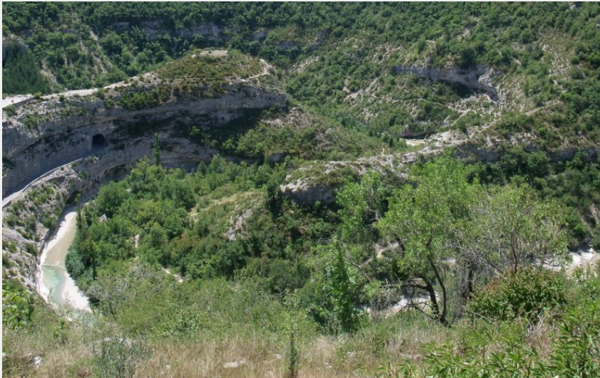
Crédit photo : Vue générale du site du Castellac, dans un méandre de la Méouge (AVernin/PnrBp)