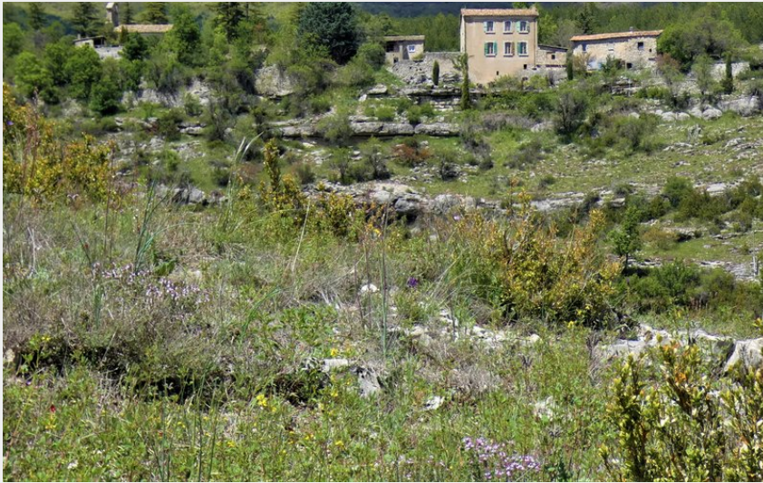
Crédit photo : Le hameau de Pomet (Office de Tourisme Sisteron Buëch)