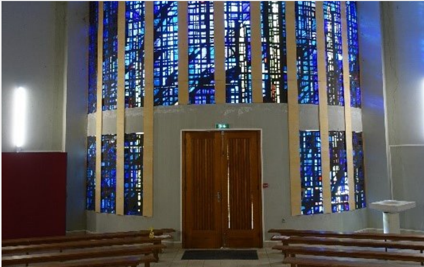
Intérieur de la chapelle et vitrail de l'entrée