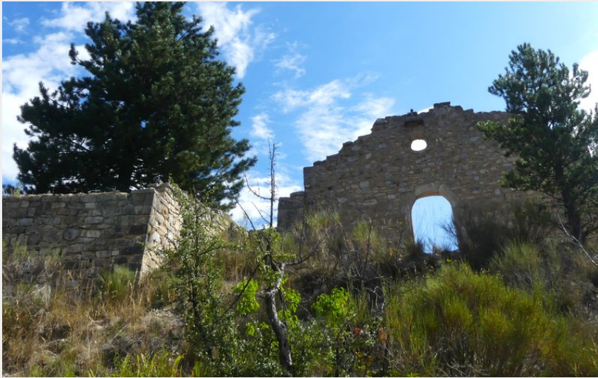
Eglise Saint Laurent