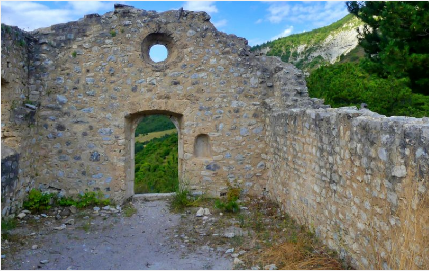
Eglise Saint Laurent