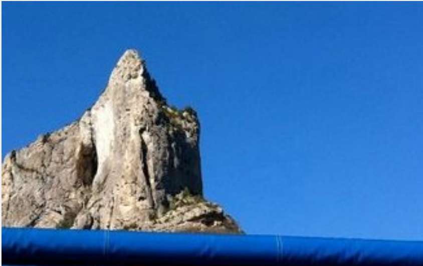
Restaurant au pied des falaises d'Orpierre