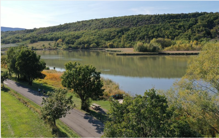
Lac de Mison (CCSB)