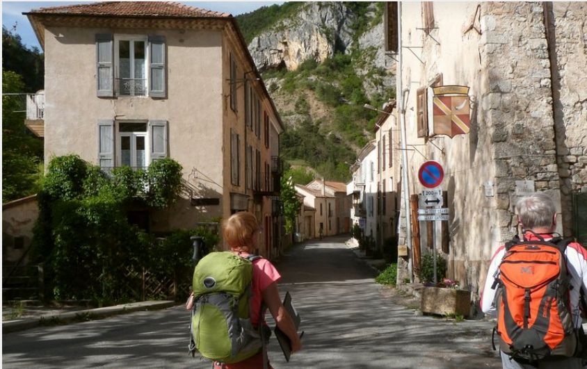
Village d'Orpierre (CCSB)