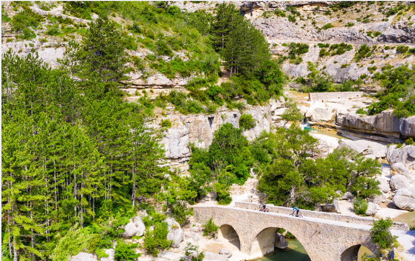
Gorges de la Méouge (Remi Fabregue)