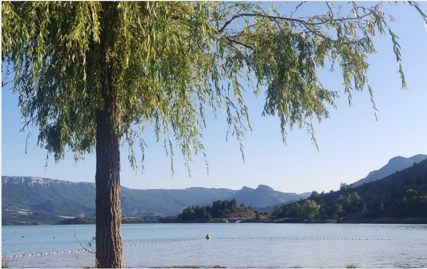
Plan d'eau du Riou (CCSB)