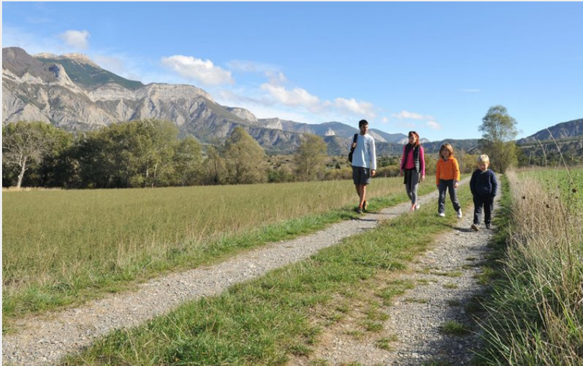
Autour de Savournon (CCSB)