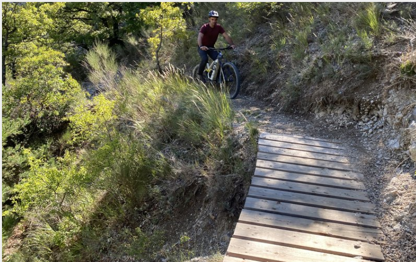
Passage sur passerelle (CCSB)