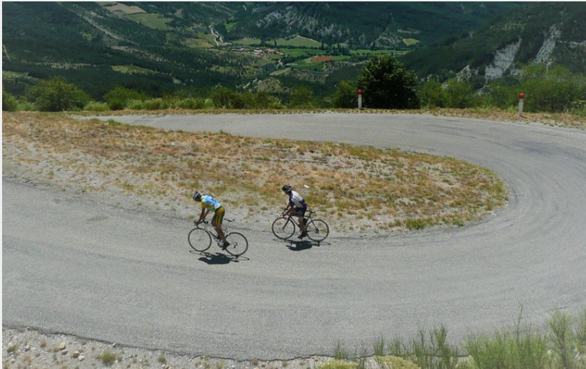
Col de Perty (CCSB)