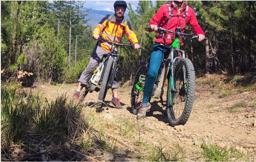
Sentier grimpant sur les hauteurs de Laragne (CCSB)