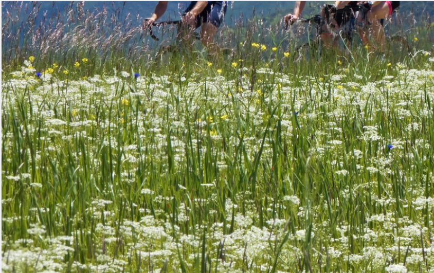
Autour de l'Épine (Office de tourisme Sisteron Buëch)