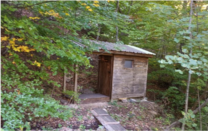
Trou du Jas (Office de tourisme Hautes Terres de Provence)