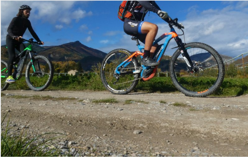
Le long du Buëch (CCSB)