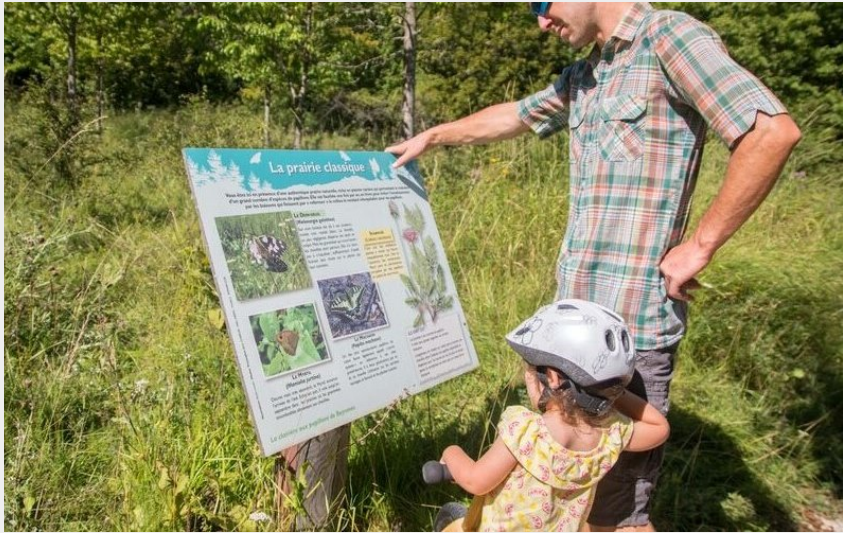
Circuit idéal pour les familles (CCSB)