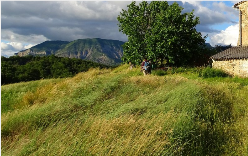
Le Verdillon (Office de Tourisme La Motte du Caire)