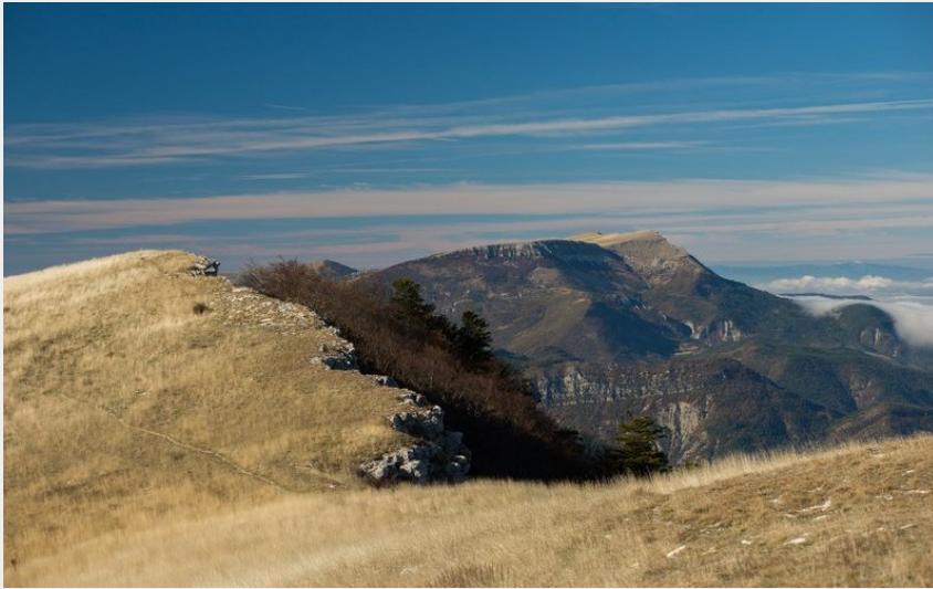
Crête de Raton (Ricardo Flores Espinosa)