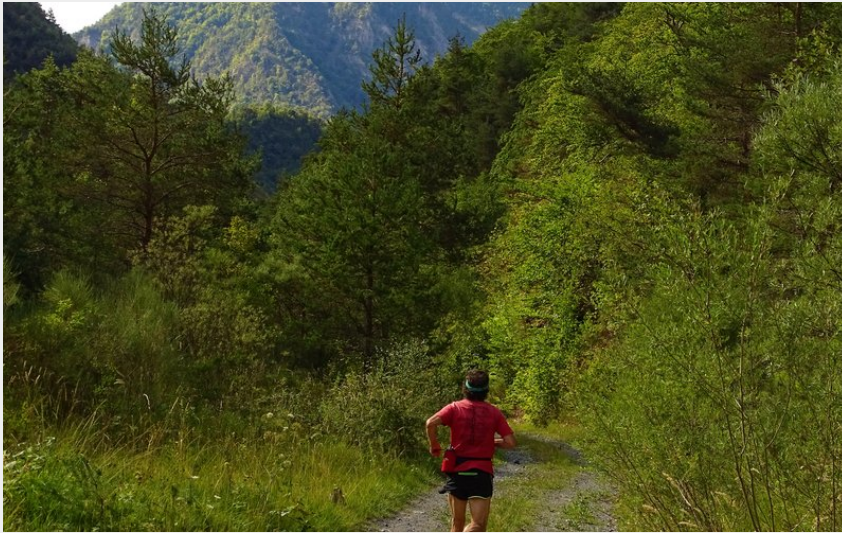
Itinéraire sauvage et peu connu (Office de Tourisme La Motte du Caire)