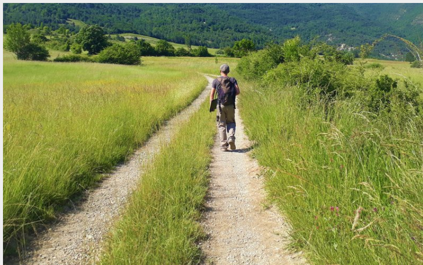
A travers champs (CCSB)