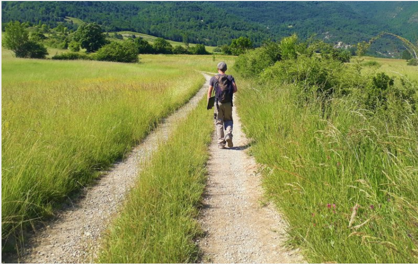
A travers champs (CCSB)