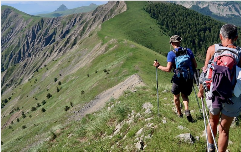
Vue époustouflante depuis la crête