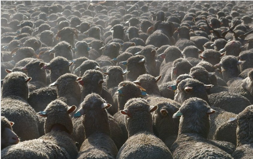
Nombreuses zones de pâturage en chemin (Office de Tourisme La Motte du Caire)