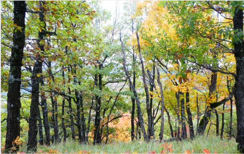
Superbe tapis de feuilles d'automne (CCSB)