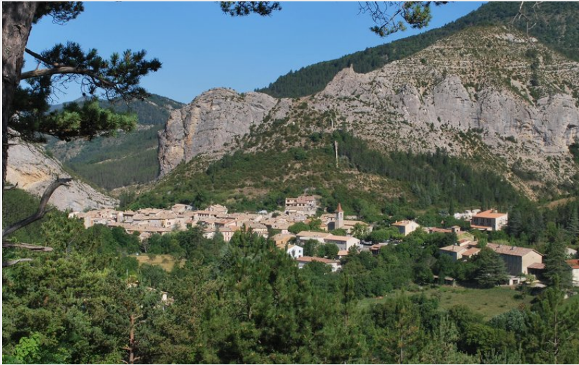
Panorama sur le village d'Orpierre (CCSB)