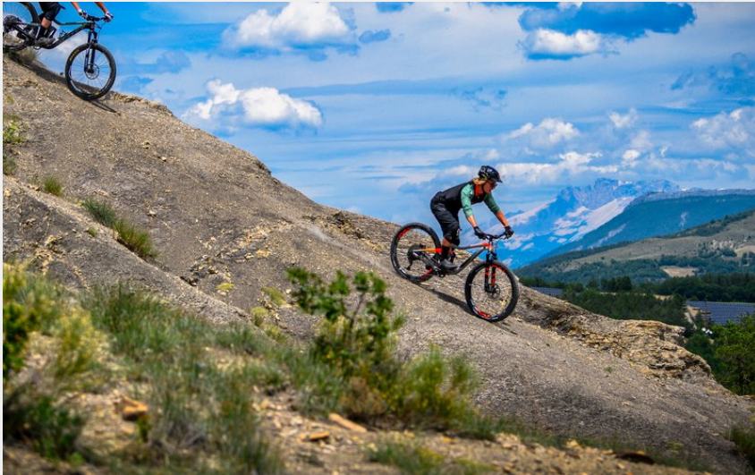
Parcours dans les marnes (CCSB)