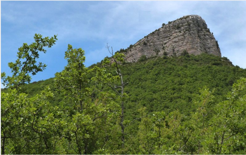
Vue sur le Mont Garde (CCSB)