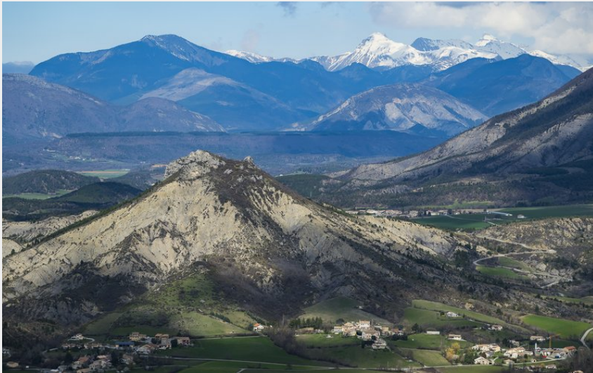
Paysage (Sam Bié)