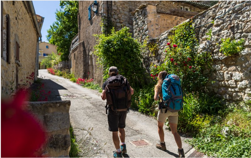
Ruelles du village d'Éourres (Martin Champon)