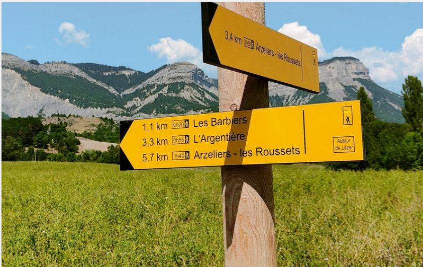
Autour de Lazer (CCSB)