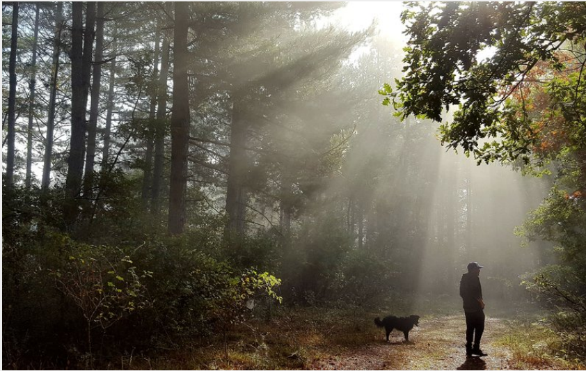
Portion en sous-bois