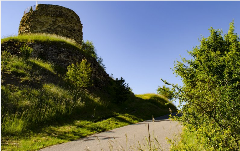
Montée à la tour (CCSB)