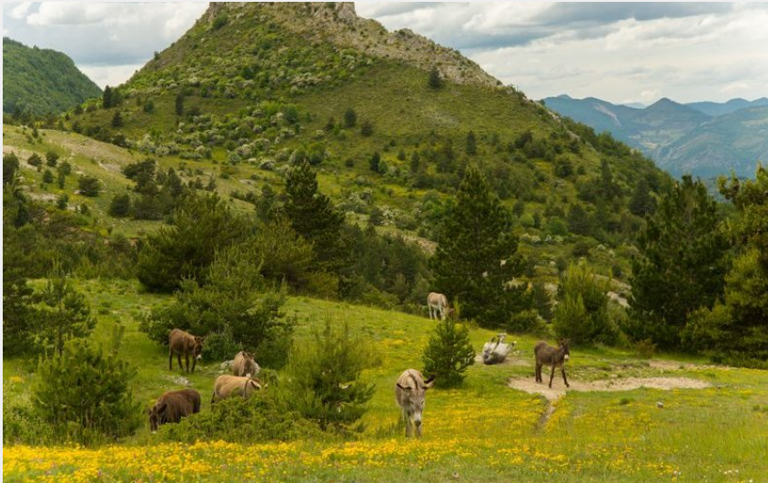
Traversée de pâturages (CCSB)