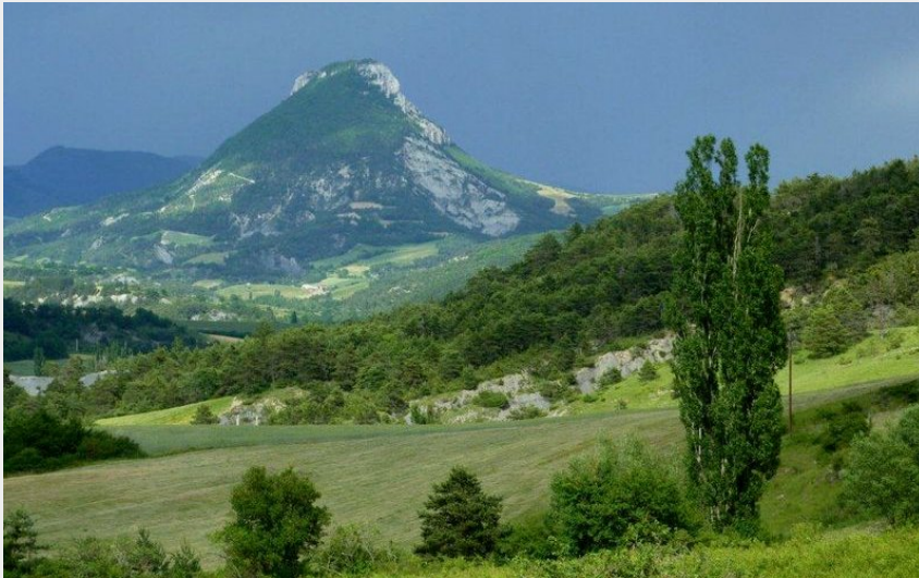
Vue sur le Risou avant l'orage (CCSB)