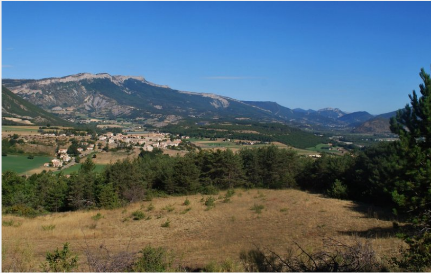
Panorama sur la Vallée du Buëch (CCSB)